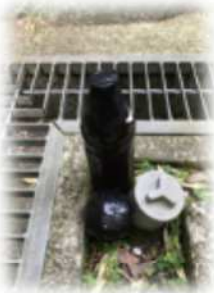
↑敷地の四隅にEM活性液とボール

EM スーパーボールについては EMJ 店長ブログ http://www.emj.co.jp/blog/emxg/ でも紹介しています。チェックしてみてくださいね。